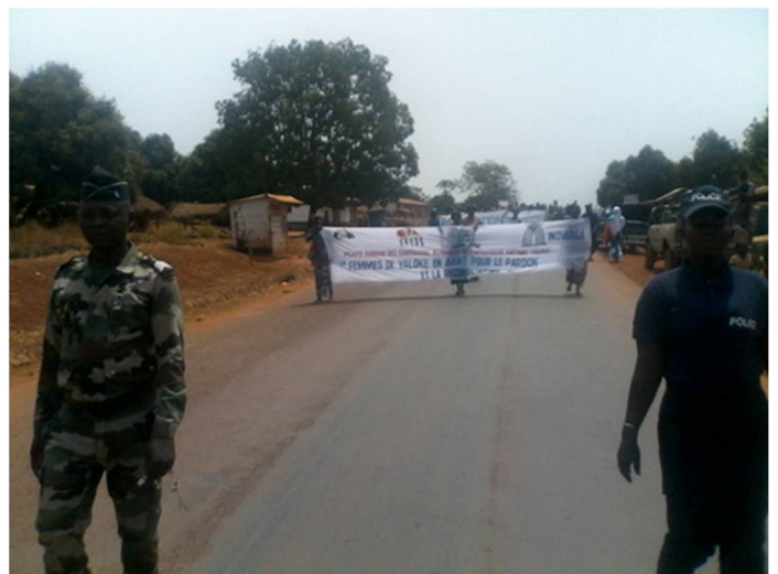
Sicherheitsorgane sichern: Friedensbildung der Polizei statt gewaltbasierte Militärbedrohung. Friedensdemo in einer Provinzhauptstadt der Zentralafrikanischen Republik.

Die Hilfswerke und Diözesen möchten ihre Kampagne in 2021 fortsetzen: auf der Basis der gewaltfreien, gemeinwesenorientierten, zivilgesellschaftlichen Praxis ihrer Partner mahnen sie: „Frieden geht (anders)!“ Dafür müssen Politik und (internationale) Institutionen Impulse bekommen und sich Räume öffnen, „Sicherheit“ neu zu denken. Prüfen wir die MSC, ob sie ein solcher Raum sein mag und arbeiten wir daran mit, dass sie ein friedensrelevantes Welt-Forum aus Deutschland werden kann. Die Praxis der Zivilgesellschaft in Deutschland und den Partnerländern der Hilfswerke denkt und tut Frieden neu und anders: das ist seriös und nachhaltig „neue Verantwortung“.