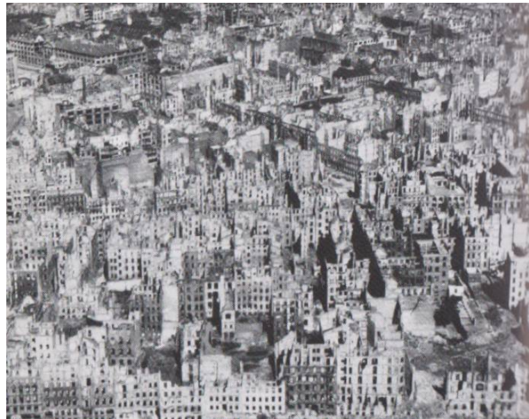
Das zerstörte Berlin 1945

So hieß es dann im Volk lange Jahre: „Nie wieder Krieg!“