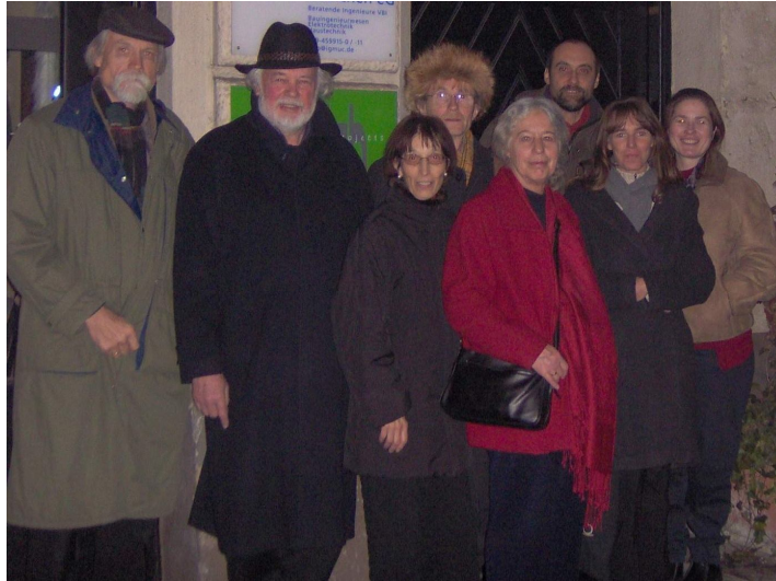
Projektgruppe bei der Vereinsgründung 2006