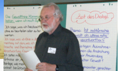
Fast alle müssen draußen bleiben – doch einer aus der Friedensbewegung darf jetzt erstmals rein zur Sicherheitskonferenz im Bayerischen Hof.